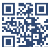
コーポレート サイト